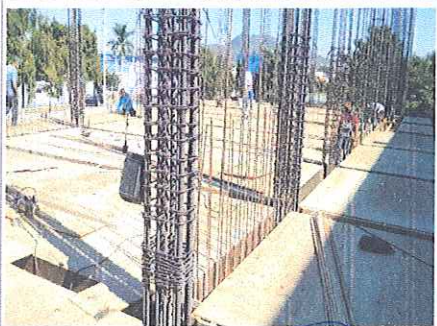
F3: Fachada posterior

Comentarios de los trabajos realizados: Cimentación y estructura de la planta baja, en la imagen se aprecia la cimbra de la losa correspondiente a la planta baja